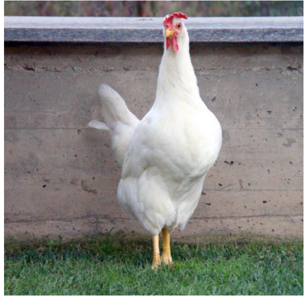
Centro per la Conservazione delle Risorse Genetiche Avicole Locali, UniTO