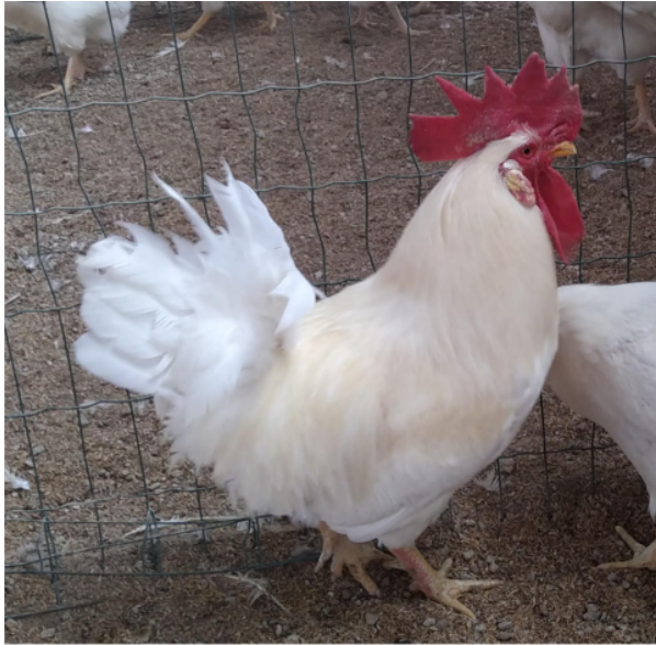
Centro per la Conservazione delle Risorse Genetiche Avicole Locali , UniTO